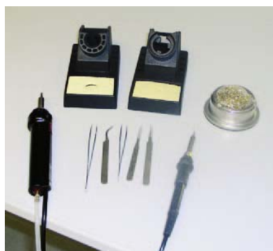
Паяльники для SD